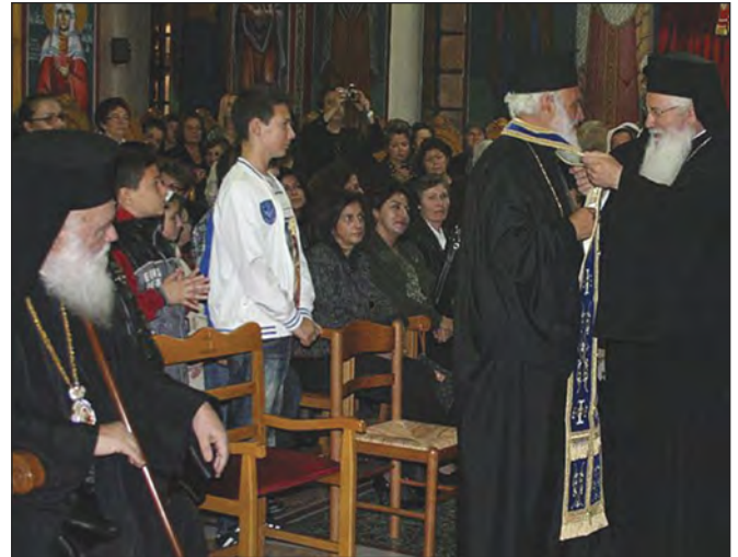
Ο Σεβ. Μητροπολίτης Θηβών και Λεβαδείας κ. Γεώργιος προσφέρει επιτραχήλιο στον τιμώμενο υπό το βλέμμα του Μακαριωτάτου κ. Ιερωνύμου.

Μίλησαν για την προσωπικότητα και το έργο του η Πρόεδρος του Συλλόγου Γυναικών Ασωπίας, ο Δήμαρχος Τανάγρας κ. Ευάγγελος Γεωργίου, ο πρώην Δήμαρχος Τανάγρας κ. Παν. Κυριάκου, ο Σεβ. Μητροπολίτης κ. Γεώργιος, και απηύθυναν χαιρετισμό ο πρώην ηγούμενος της Μονής Σαγματά π. Νεκτάριος και ο νυν Μητροπολίτης Αργολίδος και ο Περιφερειάρχης κ. Κλ. Περγαντάς. Η εκδήλωση έκλεισε με ομιλία του Αρχιεπισκόπου. Ο Μακαριώτατος κ. Ιερώνυμος εξήρε την κατά Χριστόν ζωή και το θεάρεστο έργο του αγαπητού συμμαθητή μας π. Κωνσταντίνου.