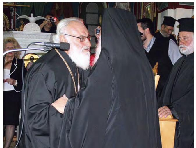
Ο Μακαριώτατος κ. Ιερώνυμος ασπάζεται τον π. Κωνσταντίνο.