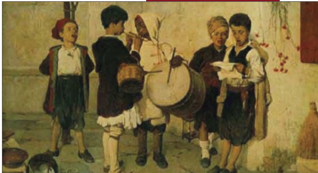
«Τα Κάλαντα», Ν. Λύτρα

Το άρθρο αυτό δημοσιεύθηκε και στην εφημερίδα «Η Φωνή της Δέλας» της Ένωσης Γαβριωτών Ναυπακτίας.