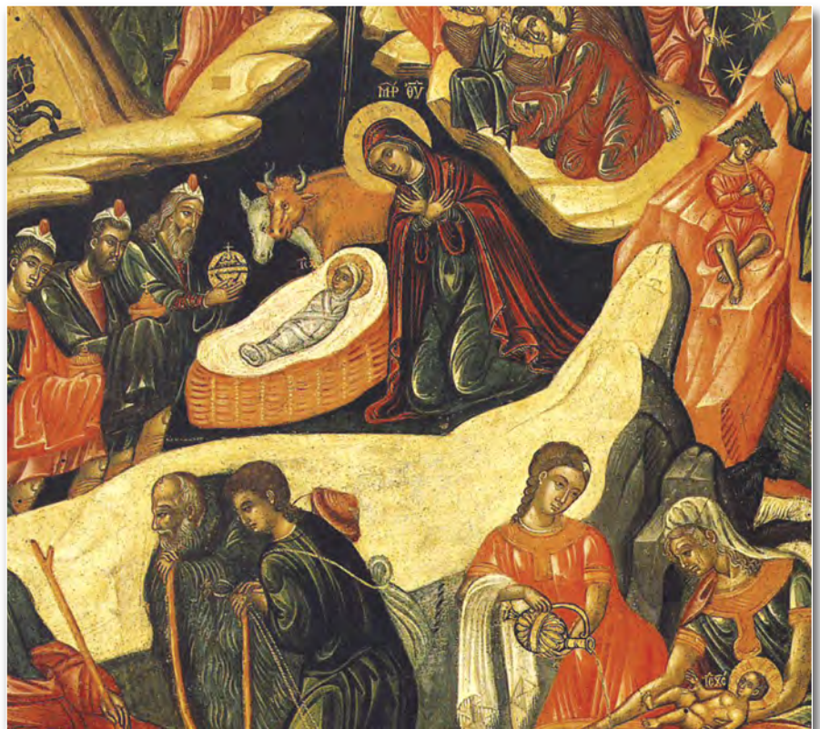
«Ἡ Γέννησις τοῦ Χριστοῦ», Μιχ. Αβράμη, πρῶτες 10ετίες 17ου αι.

νου, ἐξαπέστειλεν ὁ Θεός τὸν υἱόν αὐτοῦ, γενόμενον ὑπὸ γυναικός, γενόμενον ὑπὸ νόμον, ἵνα τοὺς ὑπὸ νόμον ἐξαγοράσῃ, ἡμᾶς τοὺς ἀνθρώπους δηλαδή, ἵνα τὴν νόθεσίαν ἀπολαύωμεν» (Γαλάτας Δ' 4-5).