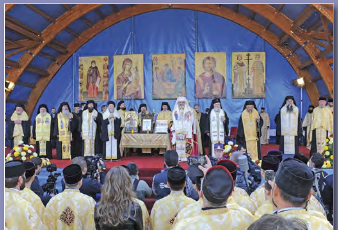
Σκηνές από τις ιερές τελετές στη Ρουμανία με τον Πατριάρχη κ. Δανιήλ και τον Μητροπολίτη Κορίνθου κ. Διονύσιο.