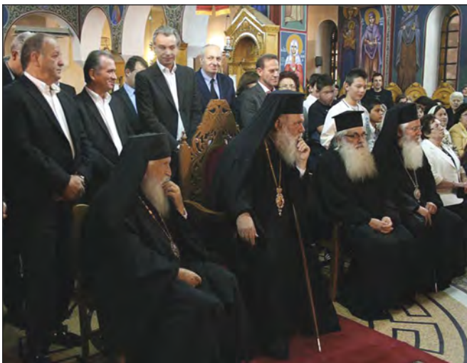
Άποψη από την τελετή βράβευσης.