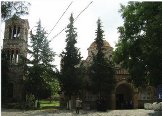
Το μοναστήρι της Σκριπούς.