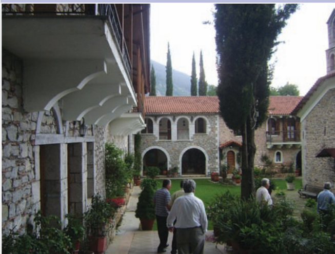
Η Ι. Μονή Ιερουσαλήμ, στη Δαύλεια Βοιωτίας.

Επειδή ήταν τόσο πολλές οι εναλλαγές σκηνών και συναισθημάτων, δημοσιεύουμε και κάποιες άλλες φωτογραφίες που αποτυπώνουν πληρέστερα την πραγματικότητα.