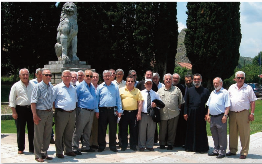
Όσοι βρεθήκαμε μπροστά στο λιοντάρι της Χαιρώνειας.

Στη συνέχεια επιβιβαστήκαμε στο πούλμαν και ξεκινήσαμε για τις υπώρειες του Παρνασσού με ξεναγό τον