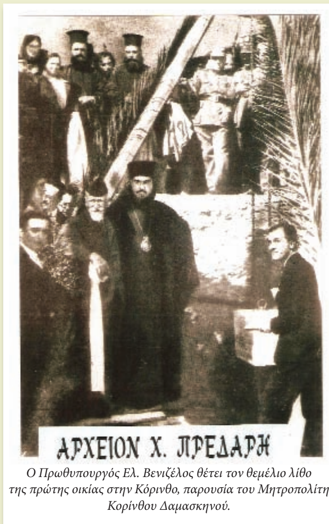
Ο Πρωθυπουργός Ελ. Βενιζέλος θέτει τον θεμέλιο λίθο της πρώτης οικίας στην Κόρινθο, παρουσία του Μητροπολίτη Κορίνθου Δαμασκηνού.

Το Οικουμενικό Πατριαρχείο (Πατριάρχης ήταν ο Φώτιος Β'), επωφελούμενο από την παραμονή του στις ΗΠΑ και εκτιμώντας τις αρετές του, τον όρισε Έξαρχο με την εντολή να συμβιβάζει τις αντιμαχόμενες μερίδες των εκεί Ορθοδόξων χριστιανών και να εξομαλύνει τις σχέσεις τους. Και σ' αυτή την αποστολή ο Δαμασκηνός τα κατάφερε. Η Εκκλησία της Αμερικής ειρήνευσε, η ενότητα αποκαταστάθηκε και δόθηκαν λύσεις στα προβλήματα που όξυναν την κατάσταση. Οι διαφωνούντες Έλληνες επισκοποι της Αμερικής δέχτηκαν να τοποθετηθούν σε επισκοπές της ελεύθερης Ελλάδας. Με δική του εισήγηση η ενδημούσα Πατριαρχική Σύνοδος εξέλεξε Αρχιεπίσκοπο Β. και Ν. Αμερικής τον μέχρι τότε Μητροπολίτη Κερκύ-