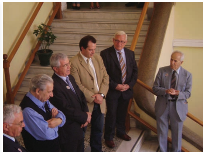
Στη Σχολή μας, μπροστά από το γραφείο των καθηγητών.