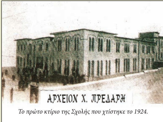
Το πρώτο κτίριο της Σχολής που χτίστηκε το 1924.

πολύ υψηλό καμπαναριό, που δεσπόζει μέχρι σήμερα σε ολόκληρη την πόλη.