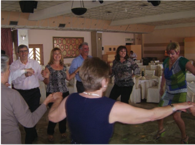
Ο χορός καλά κρατεί!