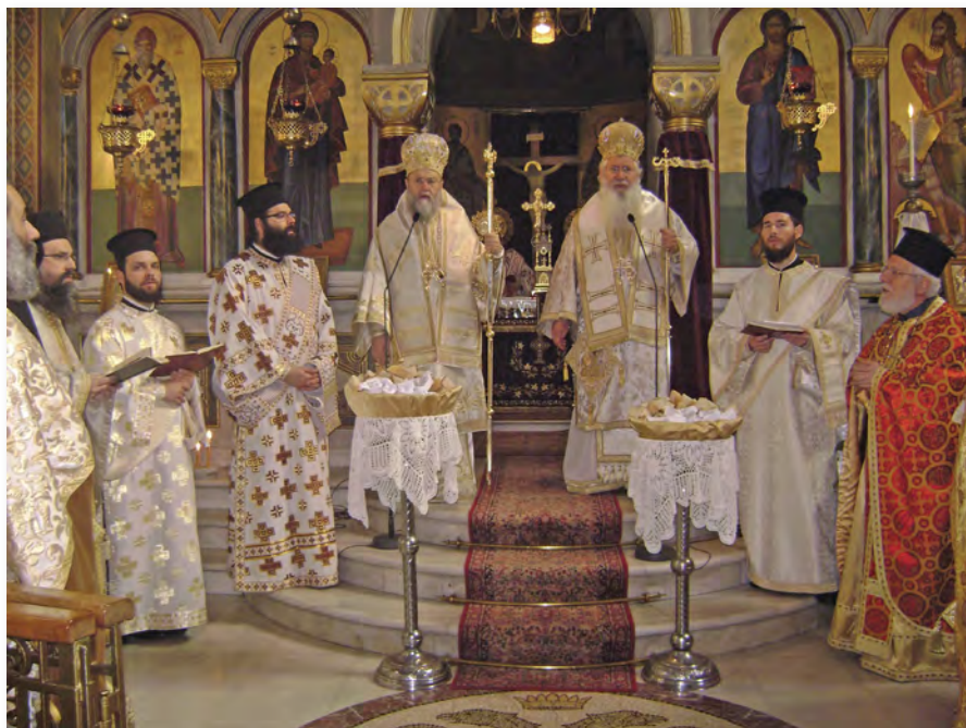
Οι συλλειτουργούντες Αρχιερείς πλαισιωμένοι από το ιερατείο.

Έγιναν τα καθιερωμένα: Μετά τη Θεία Λειτουργία, ακολούθησε το μνη-