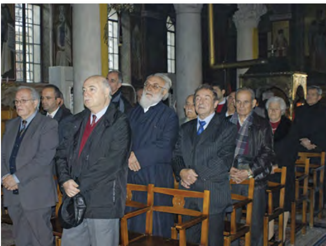
Κατά την ώρα της Θείας Λειτουργίας στον Ι. Ναό του Αγίου Σπυρίδωνος Παγκρατίου.