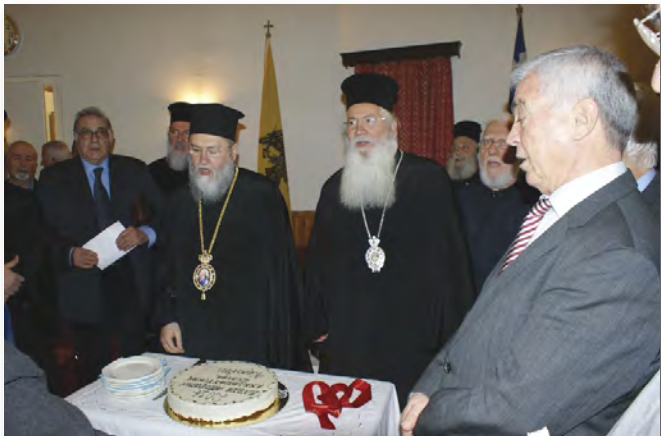
Στιγμιότυπο από την κοπή της βασιλόπιτας.