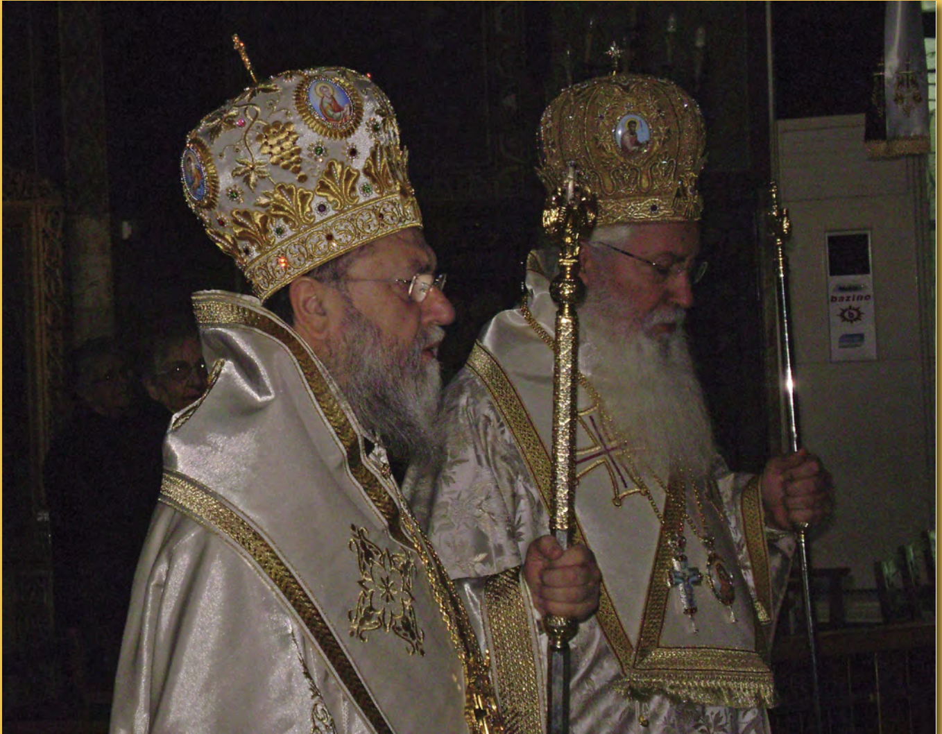
Οι δύο Αρχιερείς που τίμησαν τη συνάντησή μας κατά τη διάρκεια της επιμνημόσυνης δέησης. Αριστερά ο Σεβασμιώτατος Μητροπολίτης Κορίνθου κ. Διονύσιος και δεξιά ο Σεβασμιώτατος Μητροπολίτης Θηβών και Λεβαδείας κ. Γεώργιος.

ΠΑΡΑΚΑΛΟΥΝΤΑΙ ΤΑ ΜΕΛΗ ΜΑΣ ΠΟΥ ΕΧΟΥΝ ΣΥΓΓΡΑΨΕΙ ΒΙΒΛΙΑ ΚΑΘΕ ΕΙΔΟΥΣ, ΕΠΙΣΤΗΜΟΝΙΚΕΣ Ή ΑΛΛΕΣ ΕΡΓΑΣΙΕΣ ΣΤΗΝ ΕΛΛΗΝΙΚΗ Ή ΣΕ ΞΕΝΗ ΓΛΩΣΣΑ ΝΑ ΣΤΕΙΛΟΥΝ, ΕΦΟΣΟΝ ΤΟ ΕΠΙΘΥΜΟΥΝ, ΑΠΟ ΕΝΑ ΑΝΤΙΤΥΠΟ ΤΟΥΣ ΣΤΗΝ ΕΝΩΣΗ ΓΙΑ ΙΔΡΥΣΗ ΒΙΒΛΙΟΘΗΚΗΣ ΤΗΣ ΕΝΩΣΗΣ ΜΑΣ.