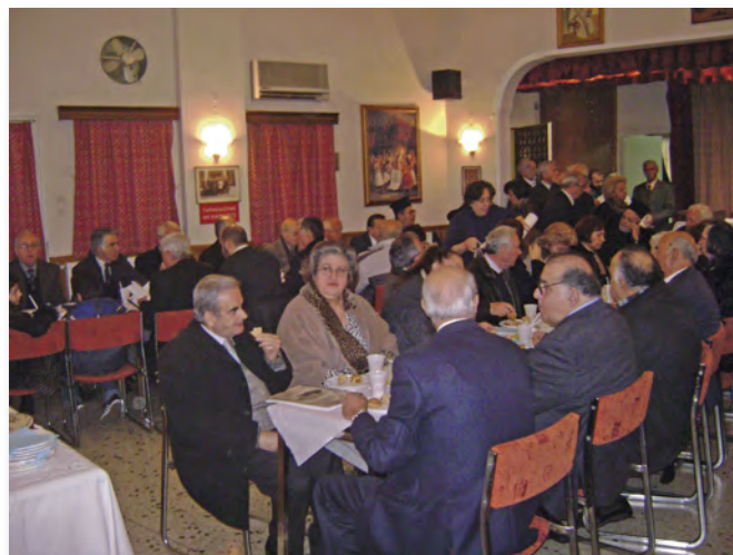
Ένα μέρος από τους συνδαιτηγμένες στην αίθουσα εκδηλώσεων του Ι. Ναού.