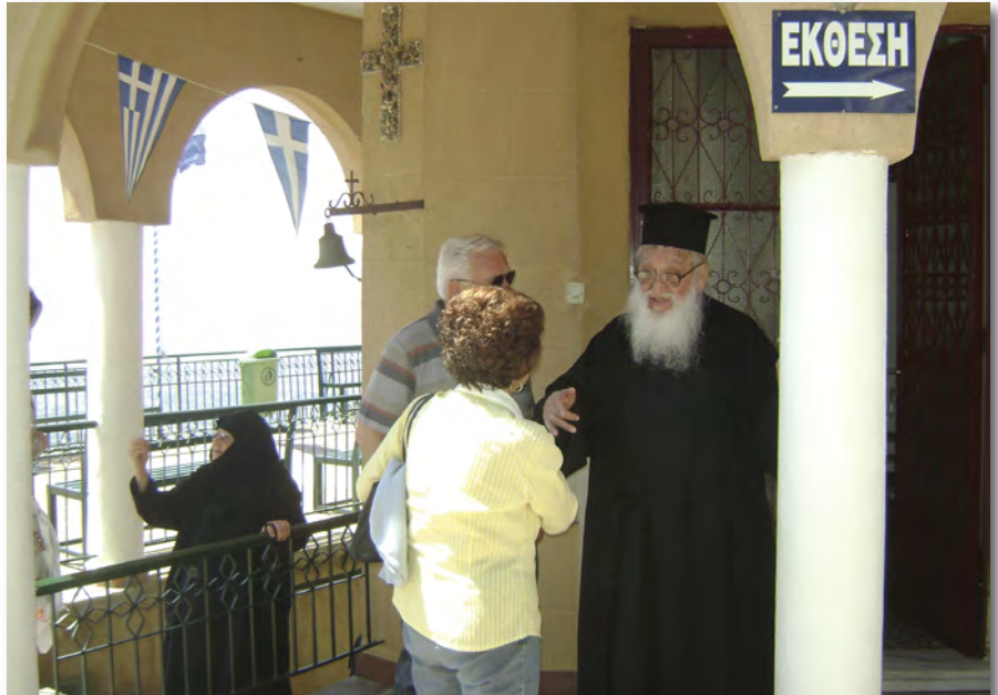
Ο Πατήρ Νεκτάριος στο μοναστήρι του Οσίου Παταπίου. Φωτογραφία από παλαιότερη εκδρομή της Ένωσης.

Εκείνο το βράδυ του Σαββάτου της 15ης Φεβρουαρίου στον Ι. Ν. του Αγίου Βλασίου αξιώθηκα, λοιπόν, να συμπεριληφθώ κι εγώ στο ακροατήριό του, που το αποτελούσαν, ως επί το πλείστον, γυναίκες και λίγοι άνδρες. Η ομιλία του θα περιείχε θέματα γενικής φύσεως αλλά και την απαραίτητη ερμηνεία της κυριακάτικης ευαγγελικής περικοπής. Κάθισα στα πίσω καθίσματα και περίμενα ν' αρχίσει ο Γέροντας το κήρυγμά του. Όταν παρουσιάστηκε, κι αργότερα, όταν άρχισε να ομιλεί, έμεινα εκστατικός, θαυμάζοντας παράλληλα και τη ζωτικότητα του! Να σημειωθεί ότι είναι υπερενεργητικότητας την ηλικία αλλά ακμαίος στο πνεύμα και τη νόη-