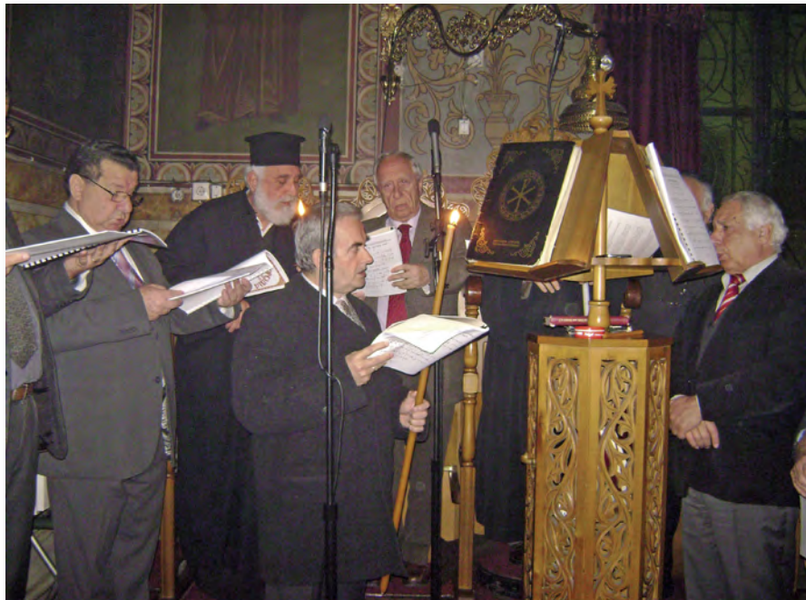
Μέλη της χορωδίας της Ένωσής μας ψάλλουν.

μόσυνο των εκλιπόντων αδελφών μας και στη συνέχεια η δεξίωση στην πολυωραία αίθουσα του Ι. Ναού και η κοπή της βασιλόπιτας του συλλόγου για το νέο έτος.