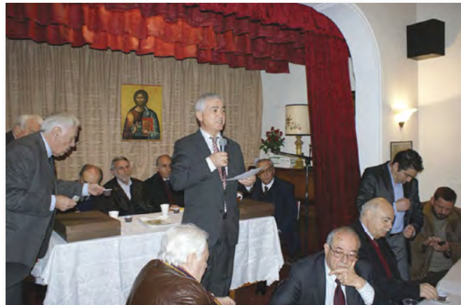
Ο Πρόεδρος της Ένωσης καλωσορίζει τα μέλη της Γενικής Συνέλευσης.